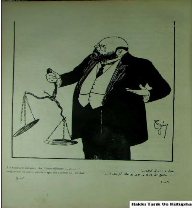
Adl ü İhsan Terazisi: Hangi eli kırlası bunu bu hale getirdi?