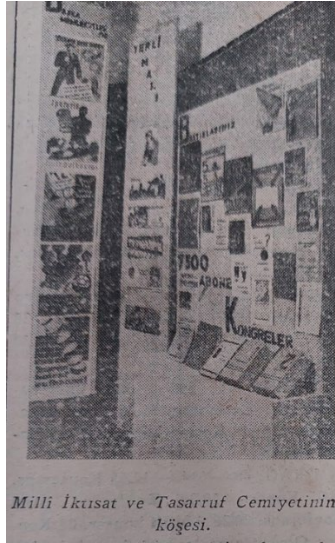
Millî İktisat ve Tasarruf Cemiyetinin kögesi.

İkinci pavyon, Millî İktisat ve Tasarruf Cemiyetine ayrılmıştı. Pavyonda, Cemiyetin tasarruf ve yerli malı kullanımı konusunda üç yıldır yaptığı faaliyetler, düzenlediği kongreler ile hazırladığı basılı yayınlar sergilenmişti.