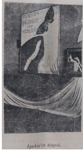
Hakimiyeti Milliye, 16 Aralık 1932, s.5

İsmet Paşa Kız Enstitüsünde açılan Birinci Kadın İktisat Sergisi'ni 18 Aralık 1932 Cumartesi günü Cumhurbaşkanı Gazi Mustafa Kemal Paşa da ziyaret etti. Daha önce de bahsedildiği üzere, önce Enstitü öğrencilerinin Ankara Halkevinde düzenledikleri müsamereye katılan, oradan Halkevinin Tarih ve Halk Kütüphaneleri bölümlerini tetkik eden Gazi Paşa, ardında da yanında bulunan Afet (İnan) Hanım ve Maarif Vekili Reşit Galip Bey ile birlikte İsmet Paşa Kız Enstitüsüne geçti. Burada Enstitü müdürü ve öğretmenleri tarafından karşılanan Cumhurbaşkanı, saat altı buçukta geldiği sergide bir buçuk saat kaldı. Gezdiği süre boyunca teşhir edilen eserleri tek tek inceledi, her pavyon için yetkililerden uzun izahat aldı.