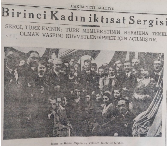
Serginin 15 Aralık 1932 Tarihinde Açılışı ( Hakimiyeti Milliye , 16 BirinciKânun 1932, s. 5)