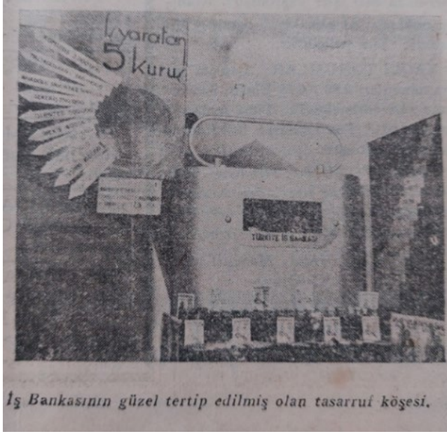
İş Bankasının güzel tertip edilmiş olan tasarruf köşesi.