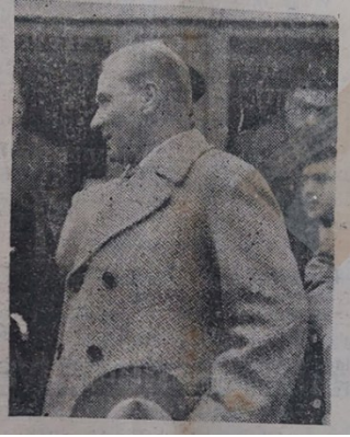
Hakimiyeti Milliye , 19 Aralık 1932, s.1

Kadın İktisat Sergisi'ni çok beğenen Mustafa Kemal Paşa, sergide emeği geçenlere “ Çok muvaffakiyetli bir sergidir. Cidden çok etraflı ve esaslı çalışıldığını anlatan eserler vardır. Muvaffakiyetlerinizi tebrik ederim. Görülmeye değer bir eser.. ” diyerek, yanında bulunan Maarif Vekili Reşit Galip Bey'e de sergiyi “ mükemmel ” bulduğunu söyleyip tebrik ve teşekkürlerini ileterek sergiden ayrıldı. Cumhurbaşkanı, Anadolu Ajansına yaptığı açıklamada da “ uyanık ve yüksek duygulu ” Türk halkının “ millî istihsali koruma ve tasarruf yolundaki faydalı çalışmasından ” duyduğu büyük mutluluğu dile getirdi. 80 Bu arada Birinci Kadın İktisat Sergisi'ni ziyaret edenlerden biri de İktisat Vekili Celal Bey idi. Celal Bey, 20 Aralık 1932 Salı günü gittiği sergide, teşhir edilen ürünleri etraflı bir şekilde incelemiştir. 81