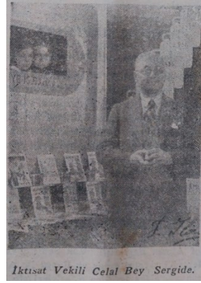
Hakimiyeti Milliye , 21 Aralık 1932, s.1