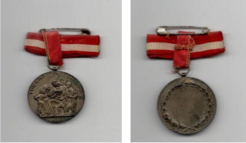
Ek 2: Aile Madalyası

Aile madalyası özel olarak tasarlanarak Darphane'de basımı yaptırılmıştır. Madalyanın bir tarafında kolları altında altı çocuğunu koruyan bir anne ve diğer tarafında içi boş bırakılmış defne dallarından bir çelenk vardır.