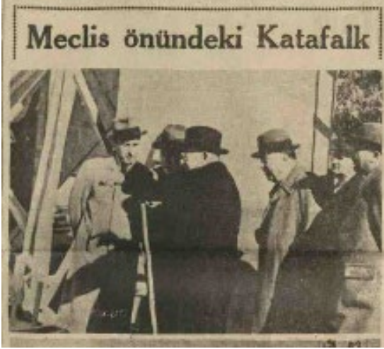
Başvekil Dr. Refik Saydam Katafalk İnşaatını İncelerken