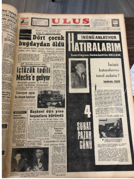
Resim 10. Ulus, 31 Ocak 1968.

günün haberleri, hava raporu ve sonunda da Türkiye ile ilgili bir belgesel filmi izletilerek yayının sona ereceği belirtilmiştir 36 .