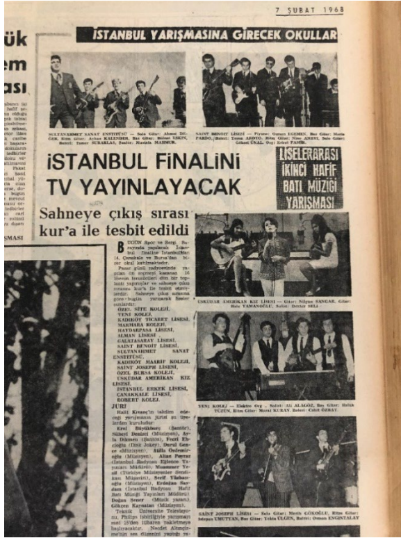
Resim 7. Milliyet, 7 Şubat 1968.