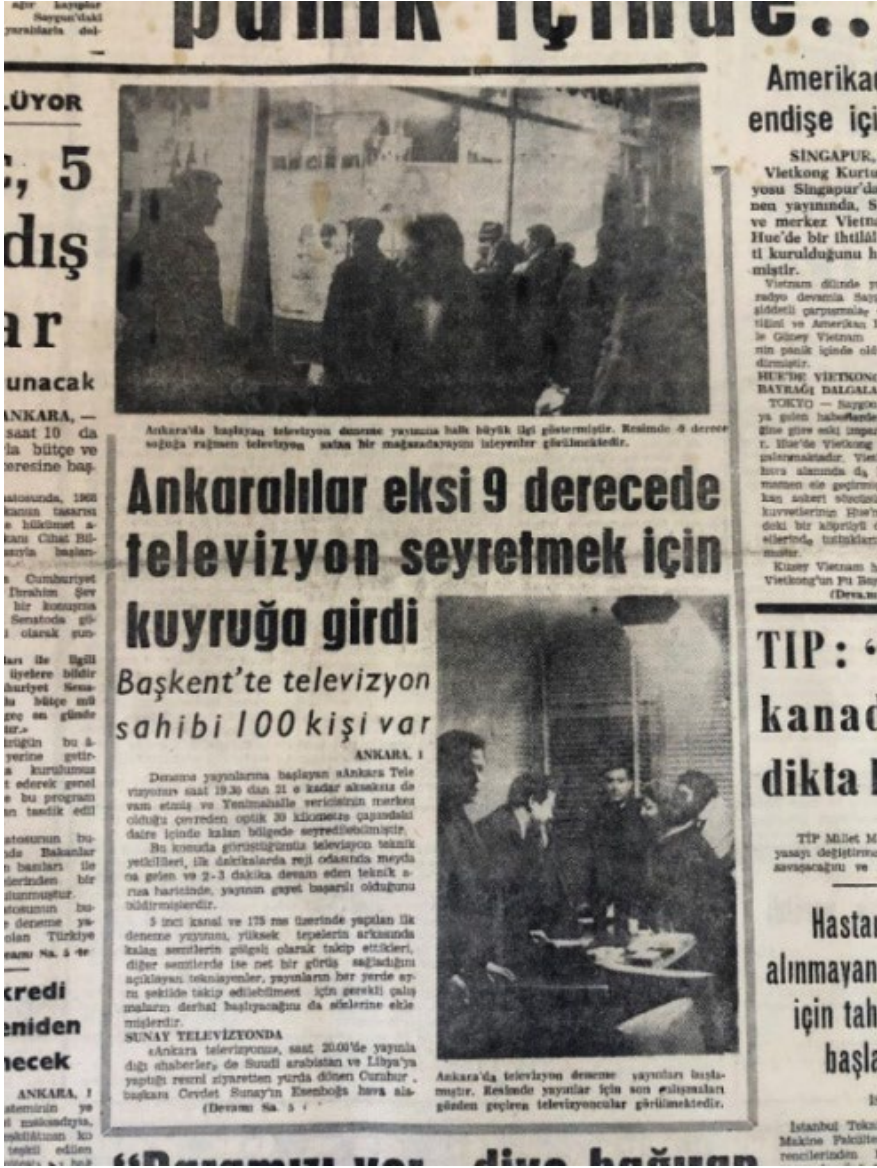
Resim 17. Vatan, 2 Şubat 1968.

Tüm bu haberler dışında 7 Şubat 1968 tarihine kadar TRT ve televizyon yayını ile ilgili ayrıca bir habere yer verilmemiştir.