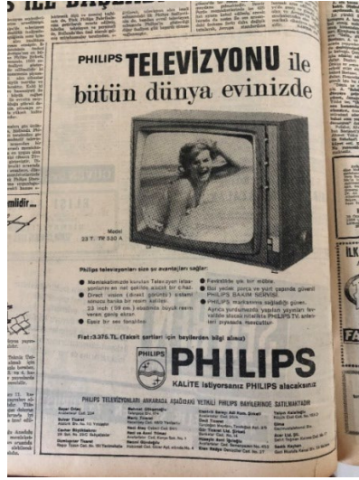
Resim 3. Hürriyet, 31 Ocak 1968.

1 Şubat 1968 tarihli gazetenin ilk sayfasında TRT yayını ile ilgili herhangi bir habere yer verilmemiştir. Ancak aynı tarihli gazetenin 6. sayfasında “Türkiye’de TV devri başlıyor” başlığıyla Türkiye’de başlanan televizyonlar için Ersin Multicore Solder lehim teli reklamı kullanılmıştır 30 .