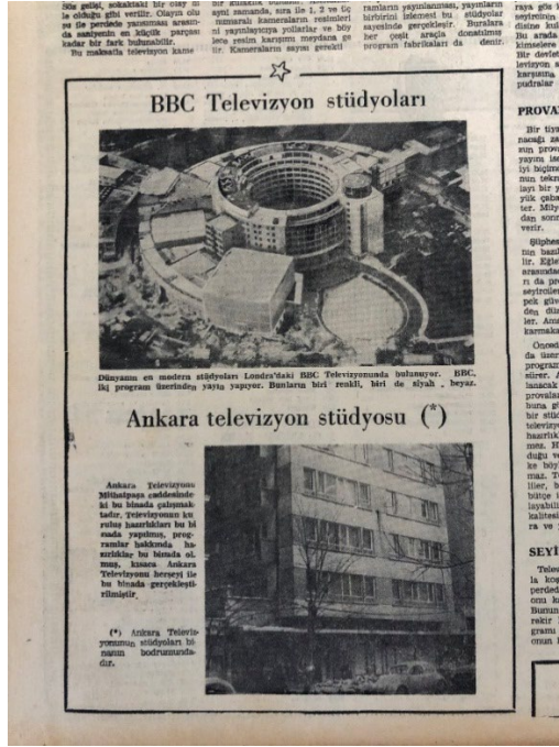
Resim 12. Ulus, 3 Şubat 1968.

“Hoş geldin televizyon!..” haber dizisinin 4 Şubat 1968 tarihli “Dünyada TV” haberinin spotunda “Yeryüzünde 195 milyon televizyon alıcısı var. Alıcı toplamının dörtte birden fazlası Birleşik Amerikada. Dünyada televizyon olmayan ülkeler – Türkiye hariç. Afganistan, Ekvatör, Bolivya, Paraguay” cümlelerine yer verilmiştir. Haberin girişinde “Haziran 1967 Pazar günü, ‘Dünyamız’ başlığı altında bir televizyon programı aynı anda Avrupa, Afrika, Amerika, Kanada, Meksika, Avustralya ve Japonya’da birden yayınlandı. Bu programın dinleyici sayısı 500 milyonu bulmuştu” cümleleri kullanılmıştır. Haberin devamında Olimpiyat Oyunları, televizyon parası, büyük masraflar, reklam gelirleri gibi alt başlıklarla tüm dünyadaki televizyon yayınları hakkında bilgiler verilmiştir. Haberde kullanılan görsellerde 1960 Roma Olimpiyatlarında televizyon kameralarının yan yana yer aldığı bir an, havaalanlarında ünlüleri karşılamaya giden televizyonculara ve Vatikan’da Papalık sarayındaki bir törenin televizyon kaydına alınması anına dair fotoğraflar kullanılmıştır 39 .