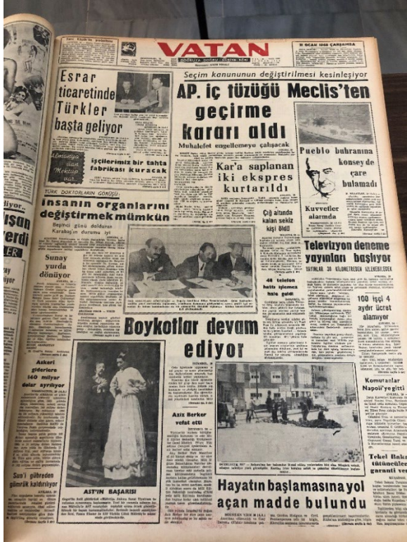
Resim 15. Vatan, 31 Ocak 1968.

31 Ocak 1968 tarihli gazetenin ilk sayfasında “Televizyon deneme yayınları başlıyor” başlığı ve “Yayınlar 30 kilometreden izlenebilecek” spotuyla verilen haberin içeriğinde “Ankara Televizyonu” yarın saat 19.30’da, deneme yayınlarına başlayacaktır. Ankara televizyonu’nun yayınları, verici merkez olmak üzere 30 kilometre çapındaki bir alan içinde seyredilebilecektir. Böylece, Ankara şehri içinde ve çevresinde oturanlar, televizyon yayınlarından yararlanabileceklerdir” cümlelerine yer verilmiştir. Haberin devamında “Ankara televizyonu’nun stadyoları, Mithatpaşa caddesinde TRT Genel Müdürlüğü’ne bağlı bir binada kurulmuştur” cümleleri kullanılmıştır 40 . Haberde dikkat çeken en önemli nokta ise televizyon yerine özellikle “Ankara televizyonu” kelimelerinin kullanılmasıdır.