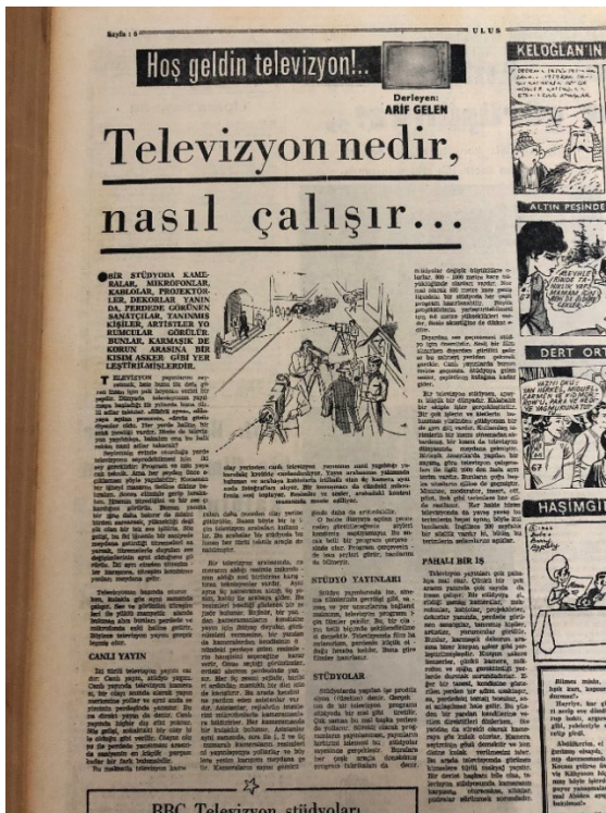
Resim 11. Ulus, 3 Şubat 1968.

şekli, canlı yayım, stüdyo yayımları, yayımlar ve televizyonun pahalı bir iş olduğundan bahsedilmiştir. Haberde kullanılan görselde canlı yayımın ne şekilde yapıldığı bir kroki ile anlatılmıştır. Haberin devamında BBC televizyon stüdyoları ile Ankara televizyon stüdyosunun görselleri kullanılarak bir karşılaştırma da yapılmıştır. BBC televizyon stüdyoları görselinin altında “Dünyanın en modern stüdyoları Londra’daki BBC Televizyonunda bulunuyor. BBC, iki program üzerinden yayım yapıyor. Bunların biri renkli, biri de siyah-beyaz” açıklaması yapılmıştır. Ankara televizyon stüdyosunun görseli altında ise “Ankara Televizyonu Mithatpaşa caddesindeki bu binada çalışmaktadır. Televizyonun kuruluş hazırlıkları bu binada yapılmış, programlar hakkında hazırlıklar bu binada olmuş, kısaca Ankara Televizyonu herşeyi ile bu binada gerçekleştirilmiştir. Ankara Televizyonun stüdyoları binanın bodrumundadır” cümlelerine yer verilmiştir 38 . Bu karşılaştırmada Türkiye’ye televizyonun geç geldiği ve kat edilecek yolun uzun olduğuna vurgu yapılmıştır.