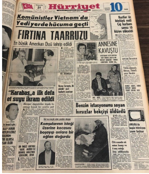
Resim 1. Hürriyet, 31 Ocak 1968.

Aynı tarihli gazetenin 8. sayfasında ise “Televizyon Ankarada” başlığı ile kapsamlı bir haber içeriğine yer verilmiştir. Haberin spotunda “Üstün evsaf ve kaliteli Philips Televizyon Cihazları da, Philips bayileri vasıtasıyla satışa arz edilecektir” cümlesi kullanılmıştır. Tam sayfanın ayrıldığı haber içeriğinde “Televizyon 20 yıl evvel gelseydi...”, “Türkiye’de Televizyon Philips ile Başladı”, “İthal malı Televizyon Cihazları ve yedek parça meselesi” ve “Televizyonda anten seçimi önemlidir...” başlıklarına yer verilmiştir 26 . “Türkiye’de Televizyon Philips ile Başladı” haberinin spotunda “Ankara’lıların da televizyona kavuşmuş olduğu şu sırada, Türkiye’ye televizyonun gelişi ve gelişmesi mevzuunda geçmişe bir nazar atfetmek faydalı olacaktır” cümlesi kullanılmıştır 27 . Haberin içeriğinde İstanbul Teknik Üniversitesi Televizyonunun Türkiye’ye ilk gelen televizyon vericisi olduğu ve Teknik Üniversite yayınlarının 1950 senesinden beri devamlı olarak yürütüldüğüne yer verilmiştir. Haberde ayrıca Teknik Üniversitenin kullandığı vericinin 1949 yılında Philips Şirketi tarafından üniversiteye hediye edildiği bilgisi de kullanılmıştır. Bununla beraber, Teknik Üniversite ve Philips arasındaki bağın şirketin yine 1964 yılında üniversiteye bir adet