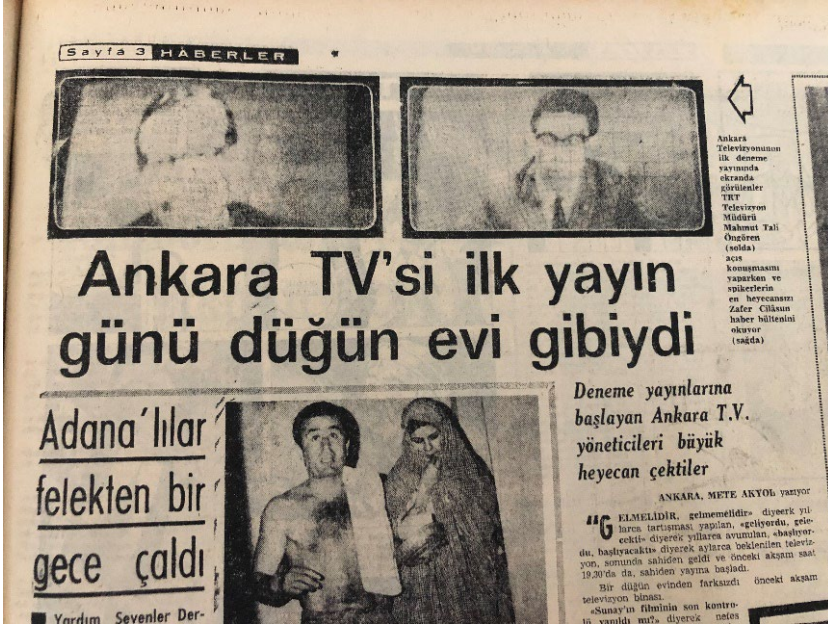
Resim 6. Milliyet, 2 Şubat 1968.

yayın günü düğün evi gibiydi” başlıklı haberin spotunda “Deneme yayınlarına başlayan Ankara T.V. yöneticileri büyük heyecan çektiler” cümlesi kullanılmıştır. Haberin girişinde “Gelmelidir, gelmemelidir” diyerek yıllarca tartışması yapılan, ‘geliyordu, gelecekti’ diyerek yıllarca avunulan, ‘başlıyordu, başlayacaktı’ diyerek aylarca beklenen televizyon, sonunda sahiden geldi ve önceki akşam saat 19:30’da da, sahiden yayına başladı. Bir düğün evinden farksızdı önceki akşam televizyon binası” cümlelerine yer verilmiştir 31 .