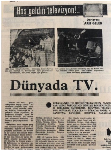
Resim 13. Ulus, 4 Şubat 1968.