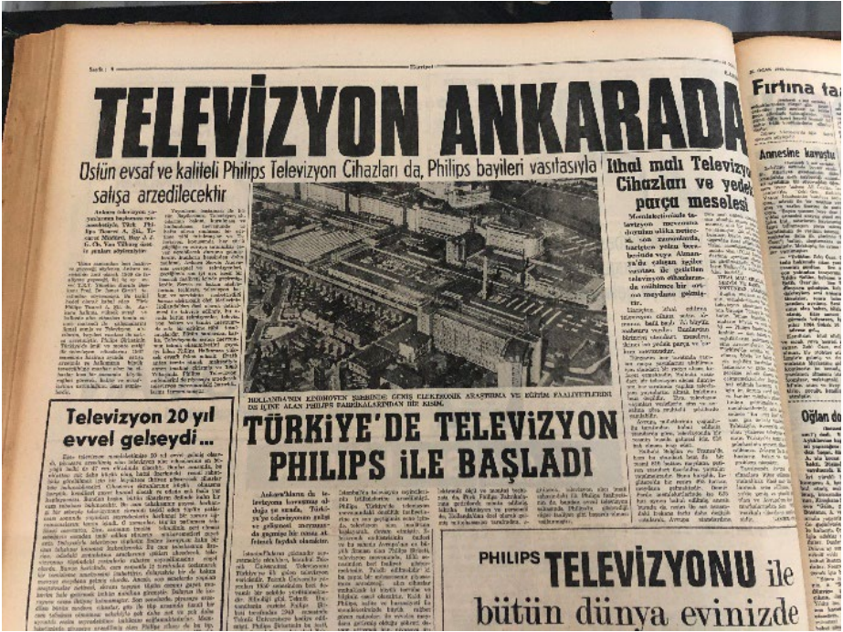
Resim 2. Hürriyet, 31 Ocak 1968.

seyyar yayım ünitesi hediye ederek o senenin ilkbaharında 19 Mayıs şenlikleri ve bazı futbol maçlarının da İstanbul'daki televizyon seyircisi ile buluştuğuna yer verilmiştir. Haberin devamında Philips'in ürettiği televizyon cihazları arasında nitelik açısından ülkemize en uygun modelin "23 T RT 530 A" tipi cihazın olduğu ve bu cihazın Türk Philips Fabrikalarında imalatına başlandığı belirtilmiştir 28 . Sayfada kullanılan ana görsel için "Hollanda'nın Eindhoven şehrinde geniş elektronik araştırma ve eğitim faaliyetlerini de içine alan Philips fabrikalarından bir kısım" resim altı yazısıyla açıklama yapılmıştır.