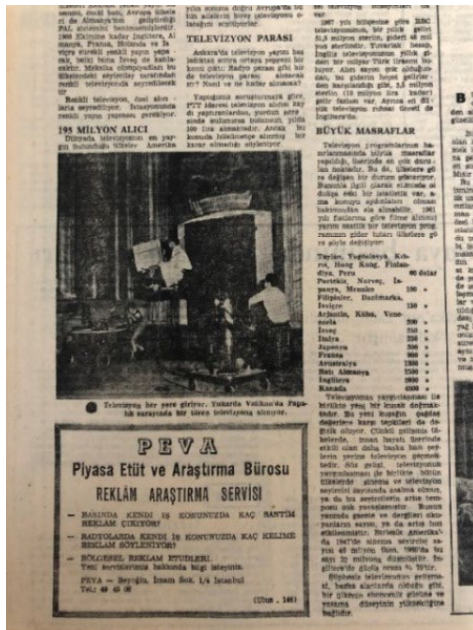
Resim 14. Ulus, 4 Şubat 1968.