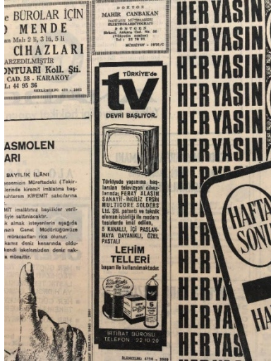
Resim 4. Hürriyet, 1 Şubat 1968.

1 Şubat 1968 tarihli gazetenin ilk sayfasında TRT yayını ile ilgili herhangi bir habere yer verilmemiştir. Ancak aynı tarihli gazetenin 6. sayfasında “Türkiye’de TV devri başlıyor” başlığıyla Türkiye’de başlanan televizyonlar için Ersin Multicore Solder lehim teli reklamı kullanılmıştır 30 .