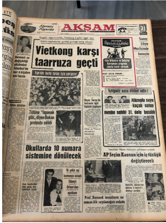
Resim 9. Akşam, 31 Ocak 1968.