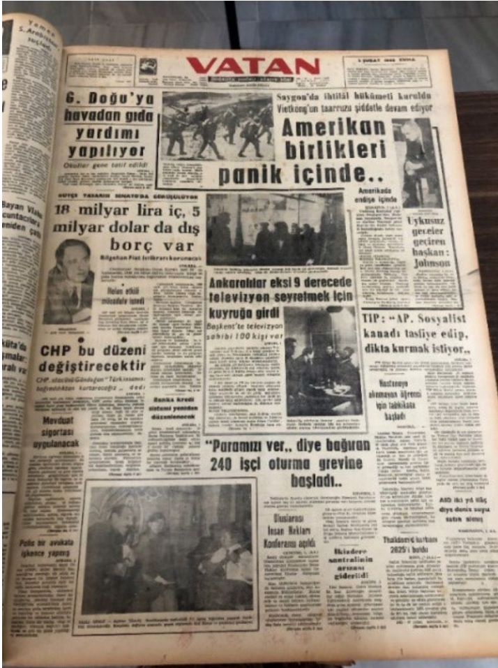
Resim 16. Vatan, 2 Şubat 1968.

2 Şubat 1968 tarihli gazetenin ilk sayfasında “Ankaralılar eksi 9 derecede televizyon seyretmek için kuyruğa girdi” başlıklı haber “Başkent’te televizyon sahibi 100 kişi var” spotuyla verilmiştir. Haberde kullanılan iki fotoğraftan ilkinin resim altında “Ankara’da başlayan televizyon deneme yayınına halk büyük ilgi göstermiştir. Resimde -9 derece soğuğa rağmen televizyon satan bir mağazada yayını izleyenler görülmektedir” cümleleri ikincisinin resim altında ise “Ankara’da televizyon deneme yayınları başlamıştır. Resimde yayınlar için son çalışmaları gözden geçiren televizyoncular görülmektedir” açıklamasına yer verilmiştir 41 .