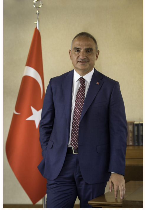
Mehmet Nuri ERSOY Kùltür ve Turizm Bakanı

5018 sayılı Kamu Mali Yönetimi ve Kontrol Kanunu'nun ortaya koyduğı stratejik yönetim anlayışı kamu kurumlarına önceden belirlenen amaç ve hedefler doğırlusunda yürütölen faaliyetleri izleme ve deęerlendirme ile stratejik planlarının yıllık olarak takibini saęlayan performans programlarını hazırlama yükümlölüğü getirmiştir. Kamuda stratejik yönetim anlayışının bir gereğı olarak kaynakların etkin ve amacına uygun olarak kullanılması ve hesap verebilirlięin saęlanması esastır. Bu bağlamda, hedeflerimize ulařmak için yürütölecek faaliyetler ile bu faaliyetlere ayrılan kaynakları ve ölçülebilir performans göstergelerini içeren "Atatürk Araştırma Merkezi Başkanlığı 2024 Yılı Performans Programı" hazırlanmıştır. Programın bařarıyla uygulanmasını temenni eder, hazırlanmasında emeğı geçen çalışma ekibine teőekkür ederim.