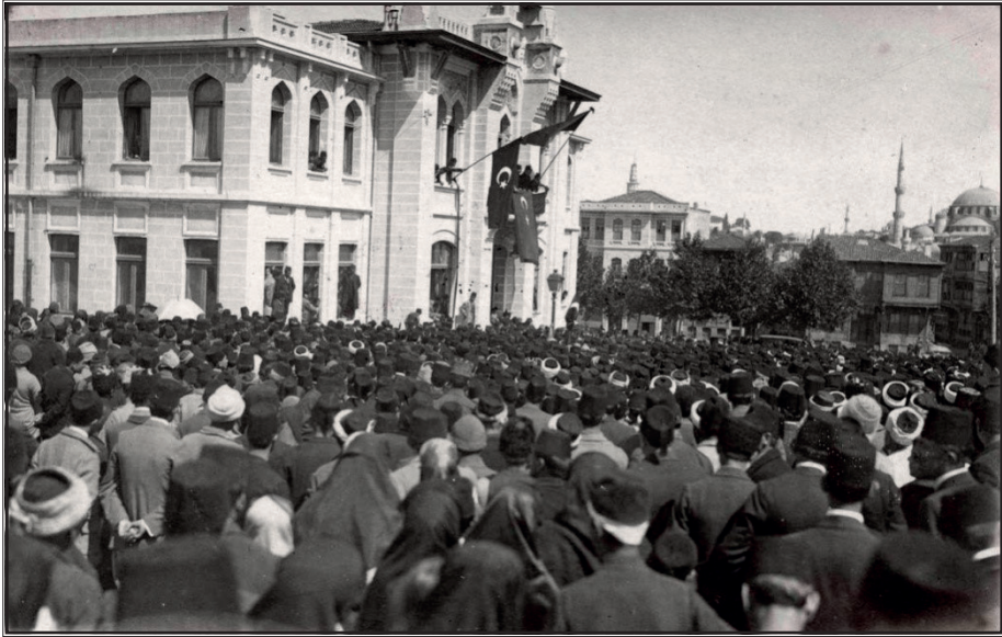
Fatih Mitingi, 19 Mayıs 1919

Müslümanlar, Türkler, Türk ve Müslüman bugün en kara gününü yaşıyor. Gece karanlık bir gece fakat insanın hayatında sabah olmayan bir gece yoktur.... Elimizde top ve tüfek denilen alet yok fakat ondan büyük, ondan kudretli bir silahımız var, hak ve Allah. ....Bugün buraya toplanan şu halk kitlesinin tek bir isteği var, en tabii haklarının kendisinden alınmamasıdır... Bütün insanların halkı Büyük Allahımız şahit olsun ki bu imanımız bizi herhangi bir topu güllesine, herhangi bir zulmün ateşine karşı götürecektedir kadar kuvvetli ve ateşlidir. İşte bütün bunlara istinad ederek hakkımızı kurtaracağımızdan eminim. Yaşasın padişahımız, yaşasın milletimiz.... 467 Başka hatipler de İzmir'siz Anadolu, ruhsuz bir cesettir. 468