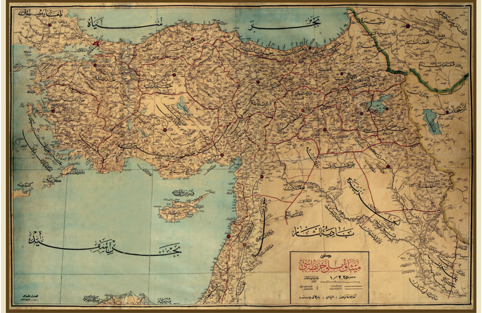
Yeni Misak-ı Milli Haritası