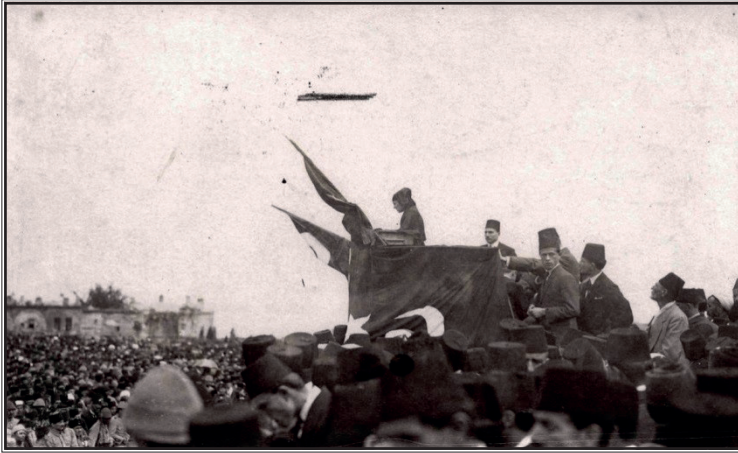
Sultanahmet Mitingi, 30 Mayıs 1919, Halide Edip Adivar

Halide Edip ayrıca, “Zito Venizelos” çığlıklarının, kanlı vakalar ve şehitlerin, “Türkleri medenileştireceğiz” diye gönderdiği ordunun, Türk efkârını çileden çıkardığını anlatıyordu. Miting ve protestoların yoğunlaştığı sırada Mustafa Kemal, 16 Mayıs 1919’da Anadolu’ya hareket etmişti. Mustafa Kemal Paşa, Amasya’dan gönderdiği telgrafta; Merkezi hükümet, tamamen ecnebi kontrolü altındadır. Türk milleti tamamen ecnebi hâkimiyetini reddetmeye karar vermiş ve bunu memleketin her tarafındaki teşekküllere ispat etmiştir. Bu muhtelif teşekküllerin faaliyetleri birleştirilmelidir 476 diyordu.